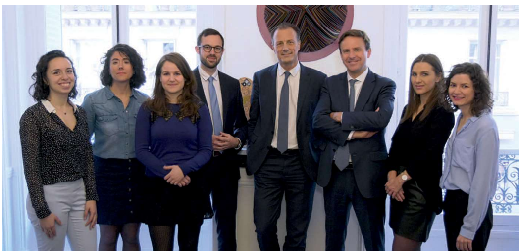
L'équipe Rencontres Internationales Althémis.